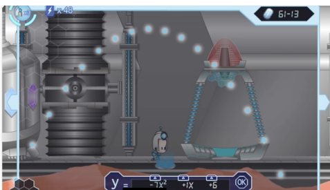
Figura 5: Puzzle 2.

Um exemplo disso é o momento em que o GUI precisa se teletransportar para outra fase. Para que consiga isso, ele precisa projetar através de um raio que sai do capacete, uma parábola que combina com o formato da câmara de teletransporte. Posicionando a parábola conforme as orientações e feedbacks passadas pelo D.O.M., o jogador faz com que GUI, consiga se teletransportar (Figura 5).