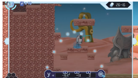
Figura 6: Puzzle 3.

jogador fica muito distante das pedras onde ele deve saltar, e não consegue avançar no jogo. Neste momento ele utiliza o D.O.M. posicionando o raio em formato de parábola para conseguir quebrar uma plataforma tornando-a móvel, permitindo com que avance no jogo (Figura 6).