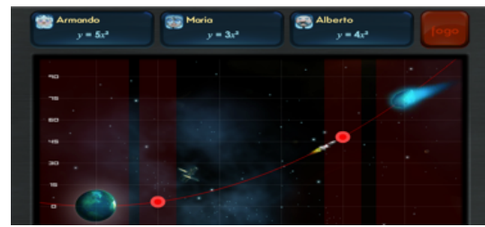
Figura 2: Tela do Jogo Save Our Dumb Planet .

Durante a interação com o jogo, um dos desafios apresentados está na Figura 2, que é identificar a trajetória correta entre as 3 funções apresentadas. Analisando o plano cartesiano, onde são vistos o Planeta Terra e o meteoro, pode-se ver as coordenadas destes dois elementos. De posse desses dois pontos, basta analisar qual das 3 funções contempla esses pontos e a escolher. Logo após esse passo, é necessário a criação de mais dois pontos que pertençam a este função como forma de garantir a trajetória do míssil.