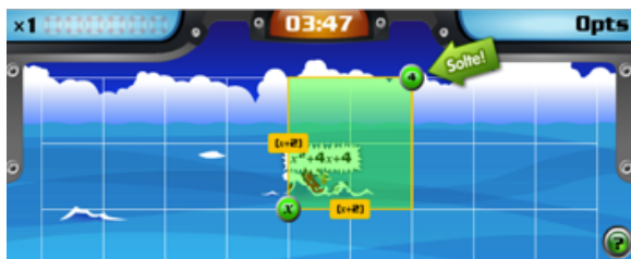
Figura 1: Tela do Jogo The Recks Factor .

Análise do jogo: Este jogo desenvolvido com objetivos educacionais. Aborda o assunto de equação do 2º grau. Atualmente não está disponível de forma gratuita. A mecânica do jogo se estabelece em selecionar com o mouse regiões retangulares que sejam compatíveis com a equação referencial que é apresentada.